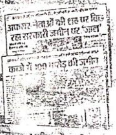
राजस्थान पत्रिका में प्रकाशित खबर।