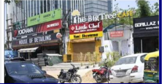
Gurugram, India-April 18, 2023: Gurugram police raided a The Big Tree Cafe at Golf Course road for allegedly serving liquor illegally to the customers without the appropriate license and arrested the two worker, in Gurugram, India, on Tuesday, 28 April 2023.(Pic to go with Leena Dhankhar's story)

Haryana's excise department is considering a crackdown on clubs, pubs, restaurants and other establishments operating without a liquor licence. Officials have identified around 20 facilities in Gurugram's Sector 29, Golf Course Extension Road and Golf Course Road that are operating without a licence for extended hours. To obtain a liquor licence, an establishment owner must apply for L4 and L5 licences. If the owner plans to keep the pub or bar open until 2am, an annual fee of INR20 lakh ($27,000) is required. For those that want to stay open until 8am, an additional INR18 lakh is required.